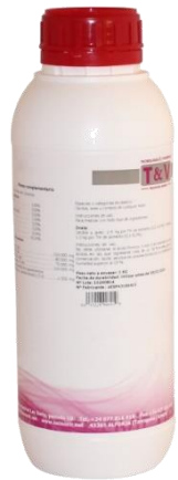
PROHEPA LIQUID 1 L