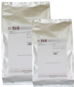
PROHEPA PREMIX 20 kg